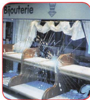
Beveiligingsglas beschermt zowel u als uw kostbare eigendommen tegen inbraak en vandalisme.